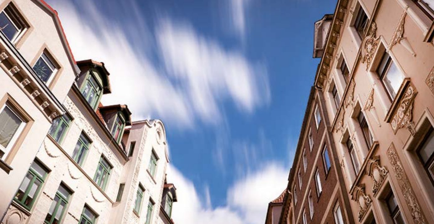
Schönes Wohnen in zentraler Lage

bauliches und wirtschaftliches Potential inmitten einer städtischen Umgebung. Doch dabei gibt es einiges zu beachten. Da die technischen und architektonischen Herausforderungen sehr vielfältig sein können, ist immer eine Betrachtung der Möglichkeiten im Einzelfall erforderlich. Hinzu kommen die rechtlichen Anforderungen, die sich aus dem Baurecht und privatrechtlichen Pflichten ergeben. Mit Unterstützung von qualifizierten Fachleuten ist die Komplexität des Bauvorhabens zu bewältigen. Mit dem vorliegenden Falblatt möchten wir Ihnen einen ersten Überblick darüber geben, woran Sie beim Dachgeschossausbau denken müssen.