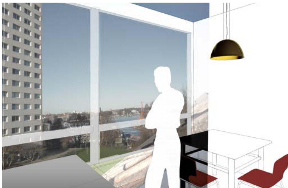
Wohnen mit Ausblick (© AX5 architekten)

Herausgeber: Landeshauptstadt Kiel, Dezernat für Stadtentwicklung und Umwelt Textgrundlage: Architekt Harald Krüger Verfasser: complan Kommunalberatung GmbH, Voltaireweg 4, 14469 Potsdam Fachredaktion: Amt 64, Frau Nothdurft Layout: Queißer PR, Titelfoto: ©Abdullah Genc Es handelt sich um ein Projekt der Landeshauptstadt Kiel mit Unterstützung der KfW-Bank und des Landes Schleswig-Holstein.