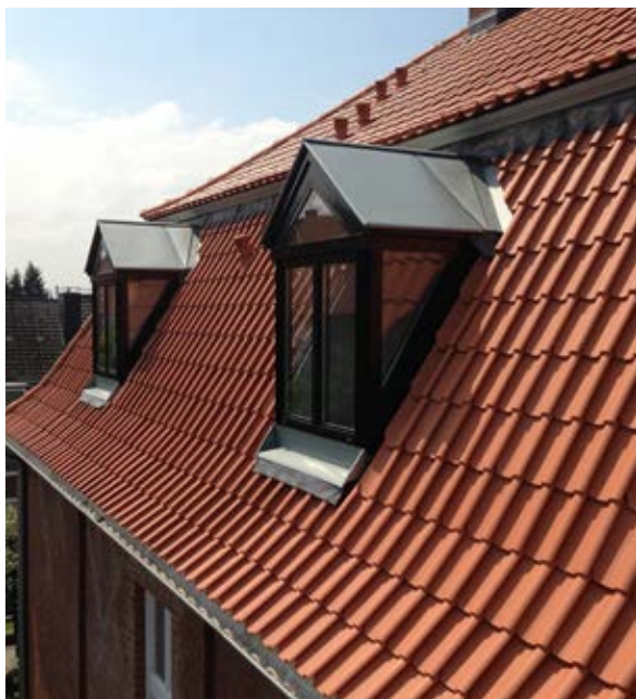
Dächer neu gestalten – Atmosphäre schaffen

Es ist unumstritten, dass in Kiel Bedarf an Wohnraum besteht. Die Dachflächen des Gebäudebestandes mit bereits vorhandener Infrastruktur, wie Strom-, Wasser-, Entwässerungs- und Heizungsanschlüsse, sowie der Nahversorgung, bieten ein enormes Potential an bebaubarer „Grundstücksfläche“. Nicht nur in Gaarden kann die Schaffung attraktiver Dachgeschossausbauten auch ein Angebot für neue Zielgruppen sein und so für eine belebende soziale Durchmischung sorgen.