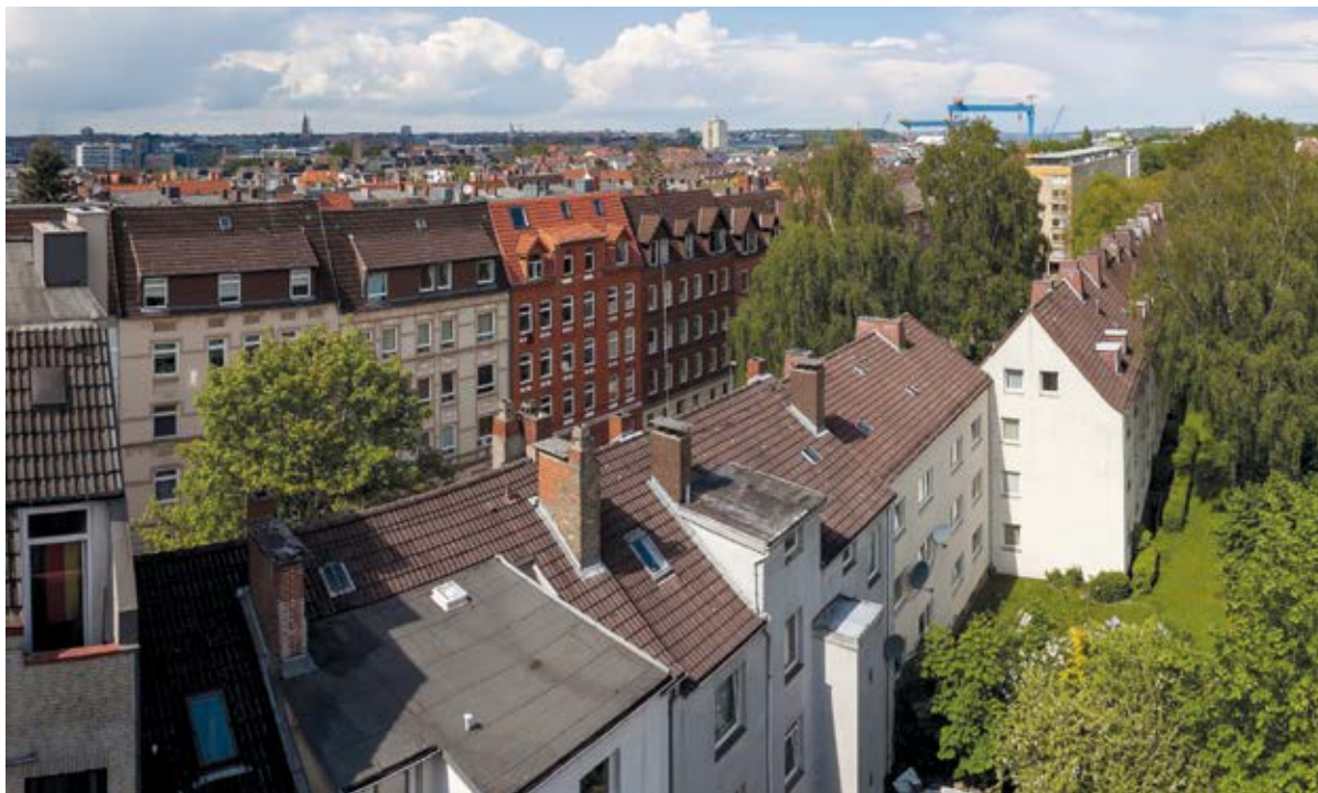
Dachausbau mit konstruktiver und gestalterischer Qualität

normgerechten Trittschallschutz herstellen. Je nach baulicher Möglichkeit kommen hierfür Unterdecken oder schwimmende Estriche (u. a. mit Schüttungen) infrage. Hierdurch wird oft gleichzeitig der erforderliche Luftschallschutz erreicht.