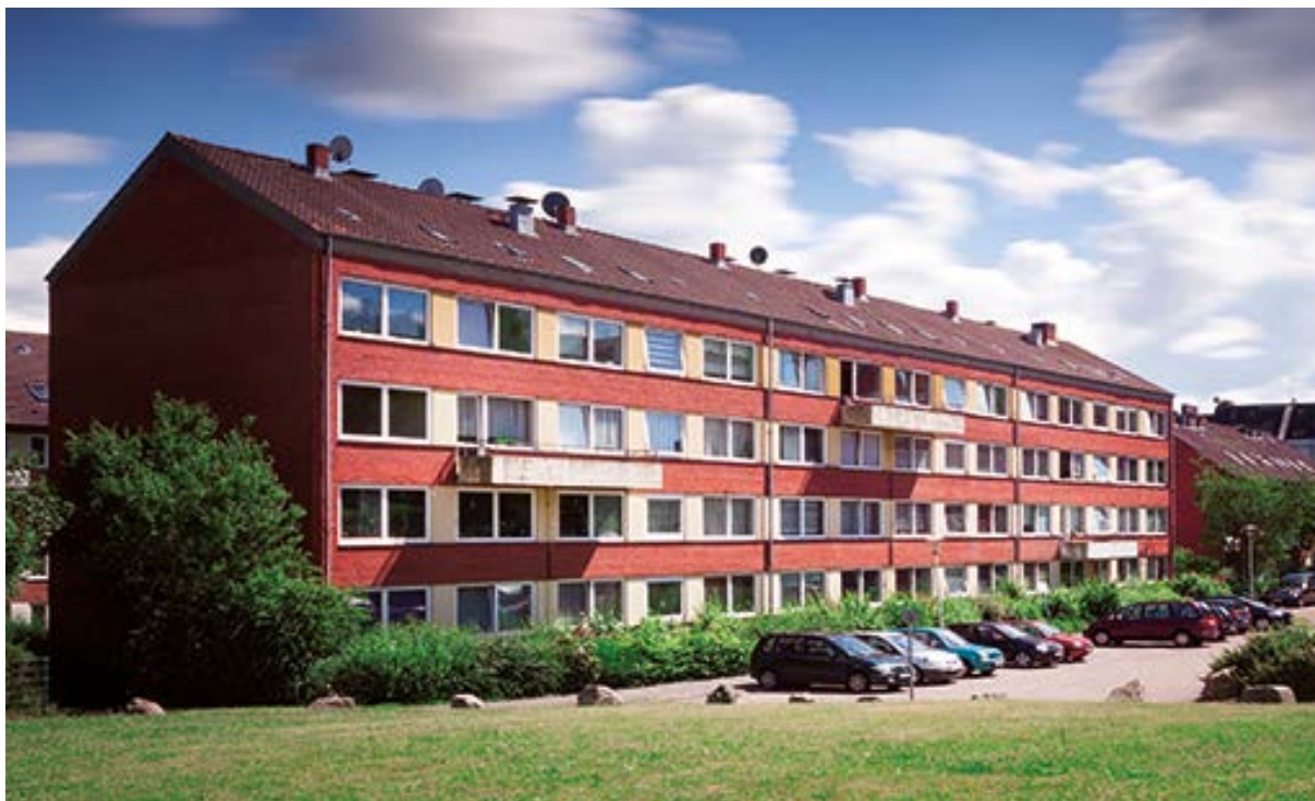
Zusätzlichen Wohn- und Lebensraum gestalten

Für eine neue Wohnung im Dachgeschoss ist nur dann ein PKW-Stellplatz nachzuweisen, wenn das Grundstück dafür geeignet ist. Diese Eignung ist mangels autogerechter Zuwegung z.B. zur Hofffläche eines Mehrfamilienhauses selten gegeben. Der Nachweis eines Fahrrad-Stellplatzes ist meist problemlos möglich.